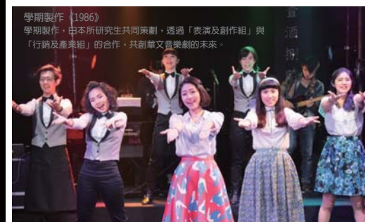
學期製作《1986》 學期製作，由本所研究生共同策劃，透過「表演及創作組」與 「行銷及產業組」的合作，共創華文音樂劇的未來。