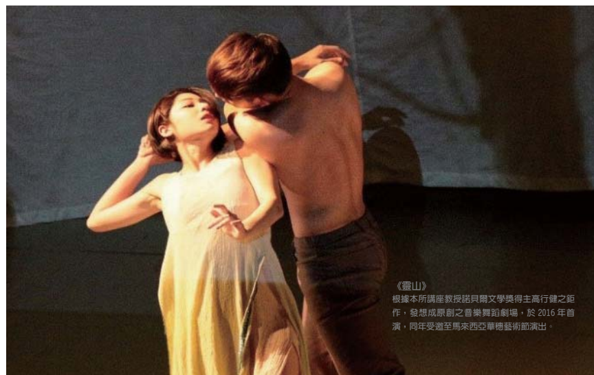
《靈山》 根據本所講座教授諾貝爾文學獎得主高行健之鉅作，發想成原創之音樂舞蹈劇場，於 2016 年首演，同年受邀至馬來西亞華穗藝術節演出。