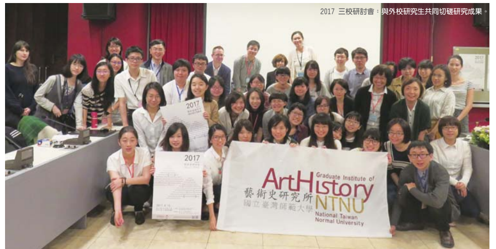
2017 三校研討會：與外校研究生共同切磋研究成果。

培養具備專業知識、思辨能力、審美涵養、國際視野、推展藝術鑑賞及關懷文化資產保存與維護的藝術史學術專才。