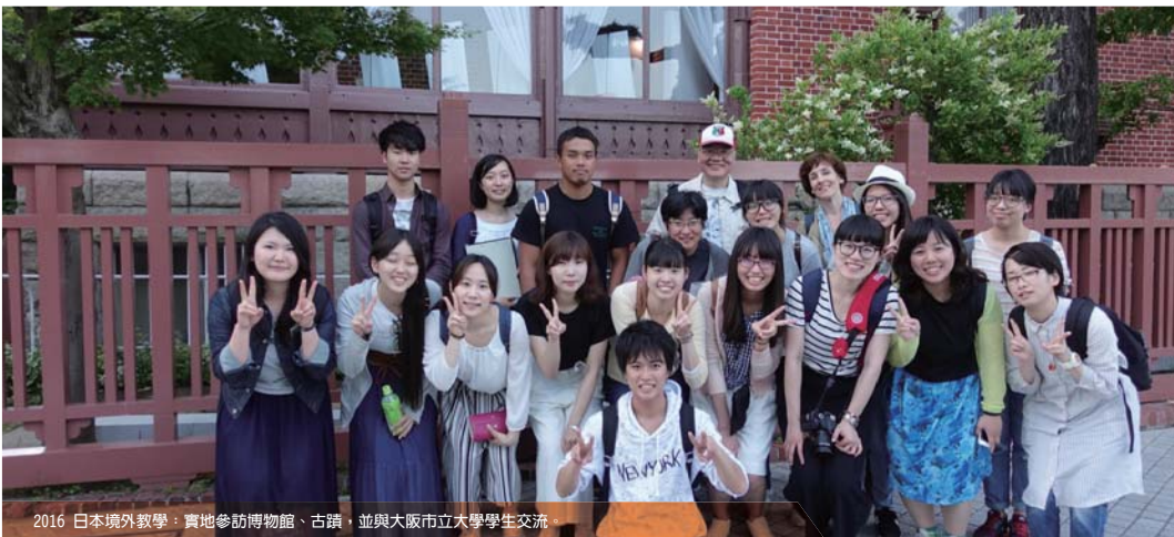
2016 日本境外教學：實地參訪博物館、古蹟，並與大阪市立大學學生交流。