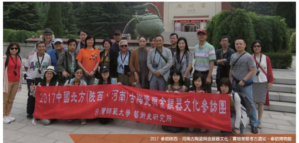
2017 參訪陝西、河南古陶瓷與金銀器文化：實地考察考古遺址、參訪博物館