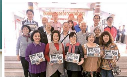
「45年挑戰」1975年埔里高中（現國立暨大附中）教學實習，2019年重回現場。